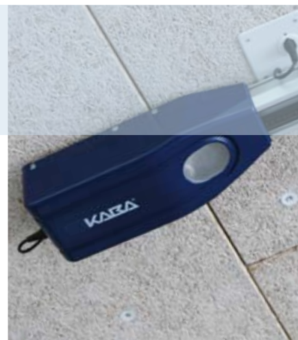
Unité d'entraînement compacte DBX