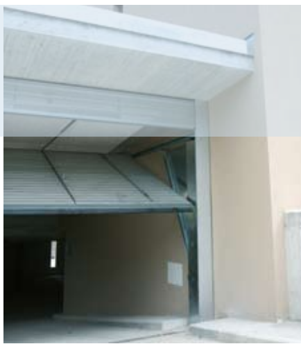
Ouverture sans débordement pour une sécurité optimale