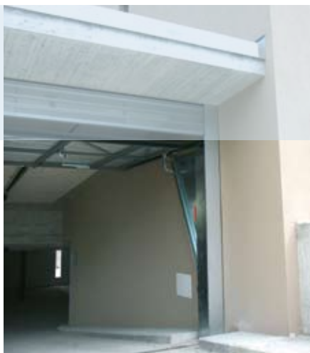
Hauteur de passage maximal

Lames pleines, lames perforées, grillage de ventilation, panneau de bois, tout type de construction est individuel et adapté à votre demande.